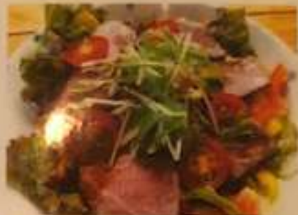
自家製 ローストビーフサラダ 850円