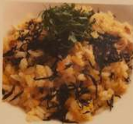
梅ひじきチャーハン 700円