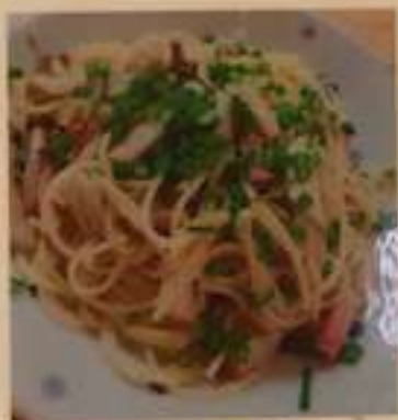
ベーコンときのこの ペペロンチーノ 750円