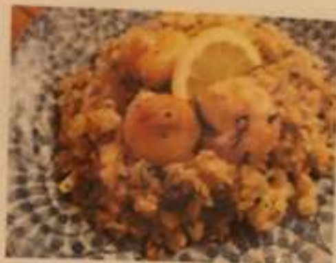
青じそえびチャーハン 780円