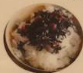
梅ひじき茶漬け 450円