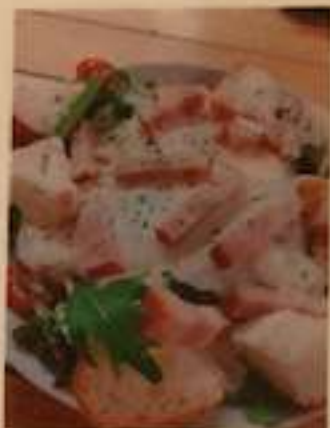
ベーコンと目玉焼きの シーザーサラダ 750円