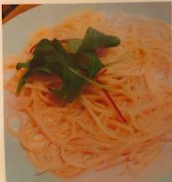
明太クリームパスタ 750円