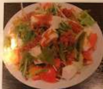
カリカリ ちりめんじゃこと 水菜の豆腐サラダ 700円