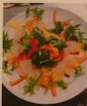
店長の 気まぐれ 海鮮サラダ 700円