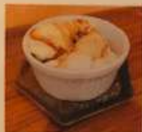
黒蜜白玉アイス 450円